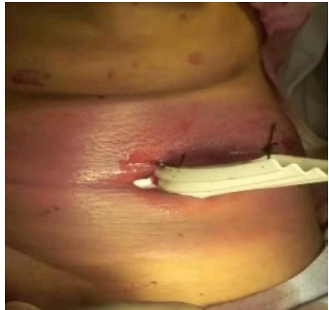
Figure 3: drainage d'une cellulite cervico faciale à point de départ un kyste du tractus thyroglosse surinfecté avec mise en place d'une lame de drainage de Delbe

L'évolution était favorable dans 96,5% des cas. Un seul cas de décès a été noté chez un patient qui présentait une CCF d'origine dentaire avec une extension médiastinale.