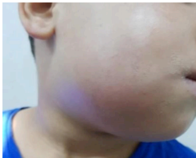
Figure 1: Cellulite submandibulaire droite

En comparant le groupe des malades exposés aux AI (48 cas, groupe 3) et le groupe des non exposés (67 cas, groupe 4), nous avons noté une fréquence plus élevée des signes cliniques de gravité avec un délai de consultation nettement plus prolongé dans le groupe des malades exposés ( Tableau II). A la biologie, les patients du groupe 3 avaient un taux moyen de CRP nettement plus élevé que le groupe 4 avec une différence significative ( p=0.001 ). Une tomodynamométrie cervico-faciale (TDM) avec injection de produit de contraste a été pratiquée dans 80% des cas, les principaux espaces anatomiques atteints étaient l'espace lingual suivi de l'espace salivaire (Figure 2). Deux patients ont présenté une extension médiastinale. Le nombre des espaces radiologiques atteints, le nombre et la taille des collections ressortaient comme des facteurs liés à l'exposition aux AI.